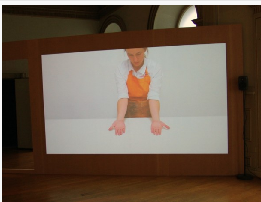
Panacea (2012), video de Catalina Bauer, Cortesía Stiftelsen Gallery 3, 14

Examinando estas experiencias, la exhibición se focaliza en obras que tienden a buscar formas alrededor de la historia reciente, desde la superficie de lo que está presente -las cosas visibles y materiales-, las percepciones y comportamientos individuales y colectivos, hasta su contrapuesto, la magia, lo secreto, lo desconocido y la ilusión. La exhibición busca trabajar en la frontera de una historia nacional densa y oscura para observar posibilidades de generar nuevas impresiones en la superficie y de sondear experiencias a través de la mente y la percepción de otras visiones.