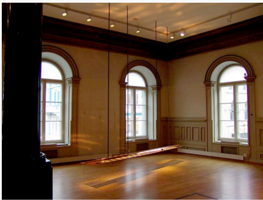
The Prediction of Tarapacá (2014) de Michelle-Marie Letelier, Cortesía Stiftelsen gallery 3, 14