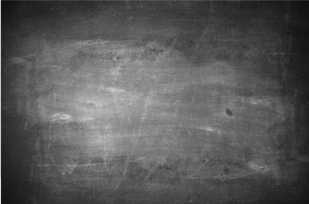
Magic Block, 2014