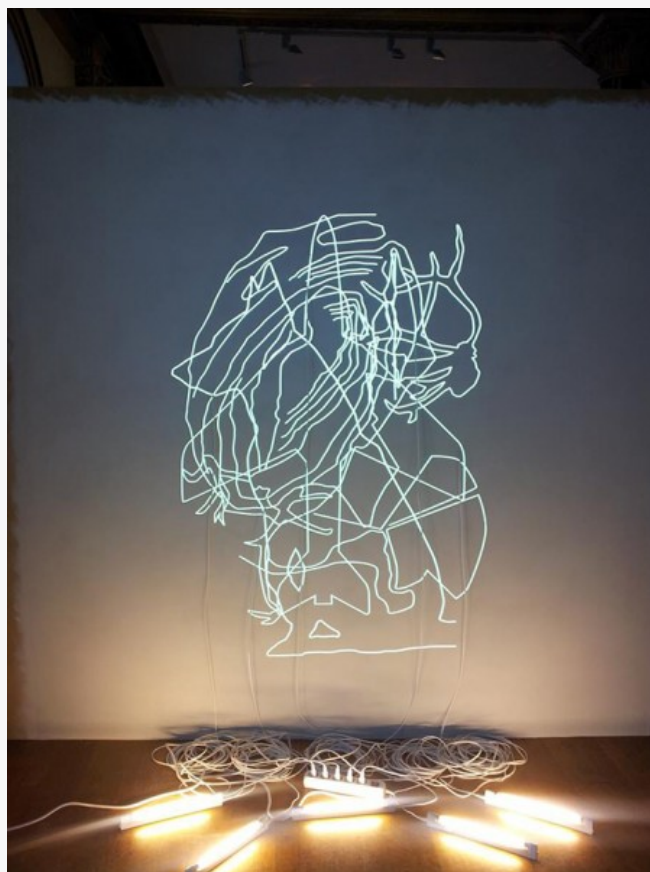
La Sirena (2014) de Claudia Missana, Cortesía Stifelsen gallery 3, 14

Con obras realizadas en los últimos 30 años, la exposición ofrece una visión exhaustiva sobre el poder que juega la apariencia. Considerando la estructura social implantada durante la dictadura de Pinochet en Chile y la pseudo apertura democrática y recepción a las actuales exploraciones artísticas, preguntas sobre lo permisible, lo representado y lo inscrito en una superficie contienen un trasfondo sobre las medidas de lo visible y el poder político del silencio. Los enfoques de estas prácticas han sido revisitados por los artistas, abriendo otros aspectos de la historia en Chile o sobre sus propias memorias que aún no han sido recogidas y recordadas. Explorando una variedad de asuntos que van desde la impermanencia, lo desapercibido y lo desaparecido, como también la vida de lo oculto, la fantasía de su presencia, o hasta la imposibilidad de ser comprendido y contado, las obras de esta muestra apuntan hacia nuevas formas de dialogar con la memoria y lo imaginario.