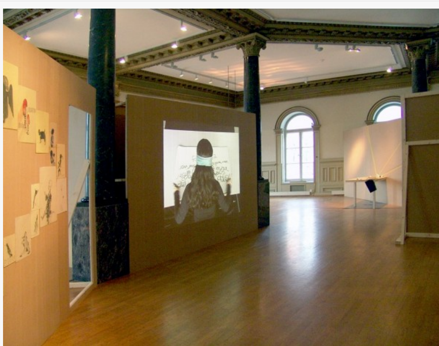
Vista de la exposición Magic Block, en Stifelsen, Gallery 3,14, Bergen, Noruega, 2014, Dibujos y video Hemisferios (2008) de Sandra Vásquez de la Horra