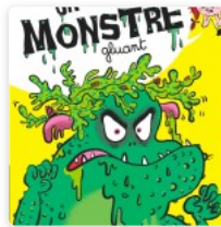
Au Secours ...