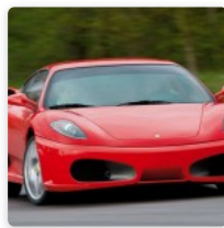
En manque d'idée cadeau ? Offrez un stage de pilotage !