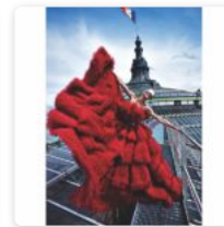
Vogue Paris 1920 - 2020