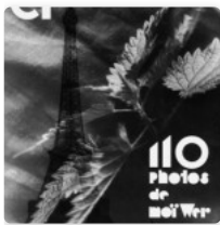
110 photos de Moï Wer