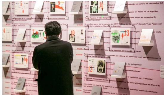
Exposición Sindemia, de la artista Voluspa Jarpa, en el Museo de Arte Moderno de Bogotá. MAMBO © Esta obra es presentada con aportes de la Dirección de Artes y Cultura, Vicerrectoría de Investigación, Pontificia Universidad Católica de Chile.

Sindemia se llama la muestra que la artista exhibe actualmente en el MAMBO, como ganadora del Premio Julius Baer a las artistas latinoamericanas. A través de esculturas, videos, fotografías y láseres, la académica de la Escuela de Arte busca denunciar, con un relato coral y colaborativo, la brutalidad policial ejercida por el Estado chileno en la revuelta social del 18 de octubre y sus similitudes con el Paro Nacional en Colombia, durante ese mismo año.