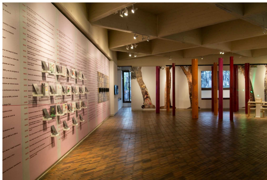
Exposición Sindemia.

"El Estado tiene las armas, sí, pero desde la sociedad civil estamos alerta y seguiremos atentos para poder construir límites desde un conocimiento que es multidisciplinario"