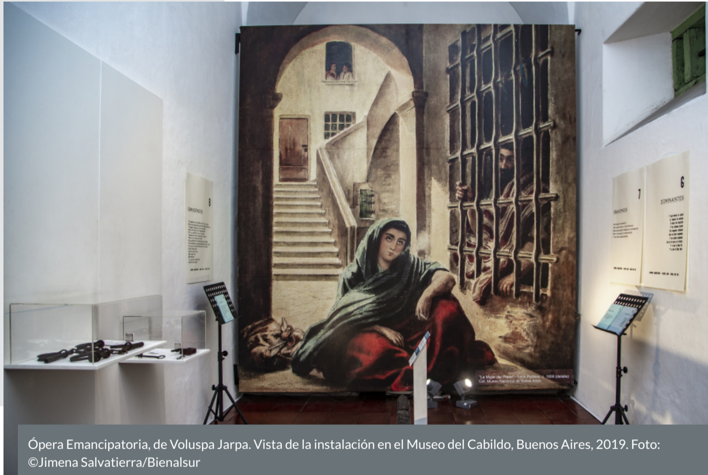
Ópera Emancipatoria, de Voluspa Jarpa. Vista de la instalación en el Museo del Cabildo, Buenos Aires, 2019.