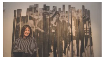
FALLECE LA ARTISTA GRACIELA SACCO